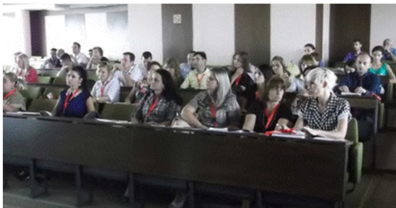
Слушателите на Обуката - 60 лица добија сертификати за лица задолжени за примена на законот