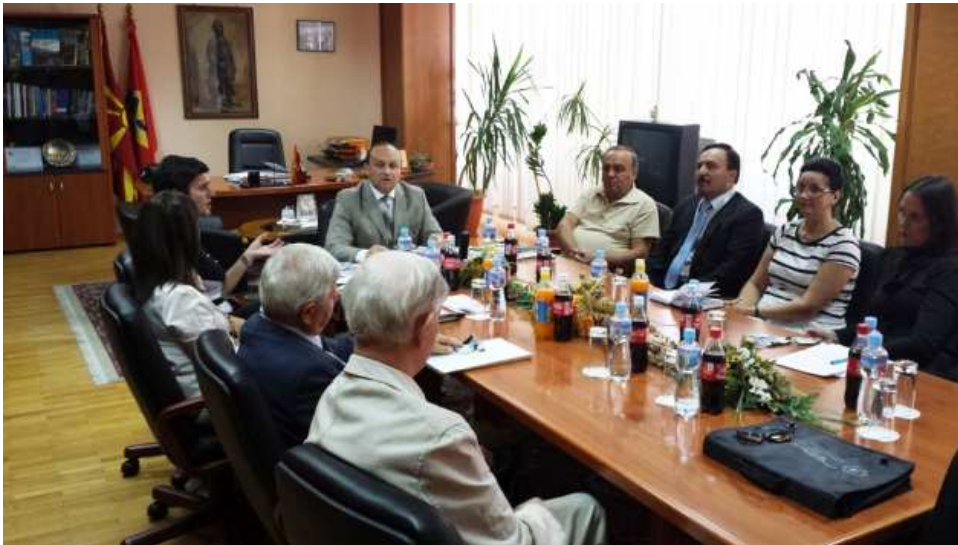
Средба на организаторите пред одржувањето на обуката

Потребно е дефинирање на некои содржини од законот, организирање обуки и вметнување одредби во колективните договори, беше кажано на “Обуката на лица задолжени за примена на Законот за заштита од вознемирување на работното место”, што се одржа на 3 септември во ССМ.