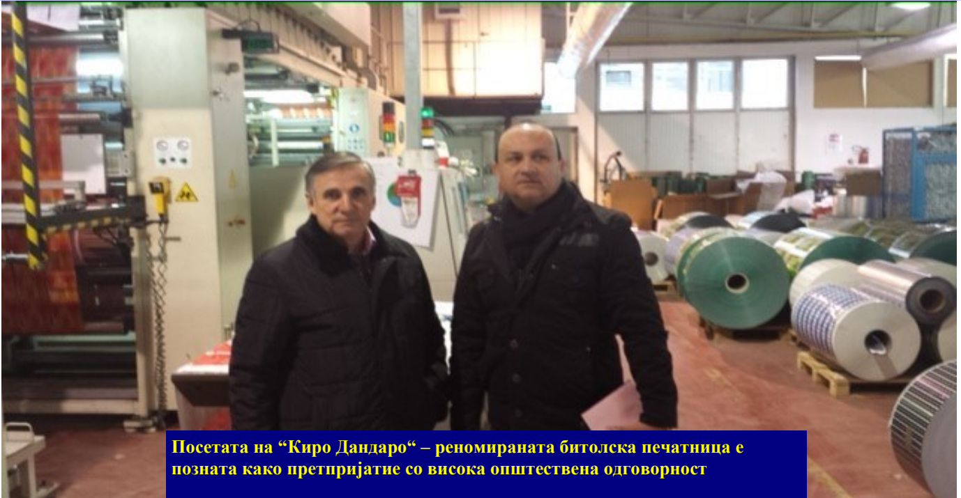
Посетата на “Киро Дандаро“ – реномираната битолска печатница е позната како претпријатие со висока општествена одговорност