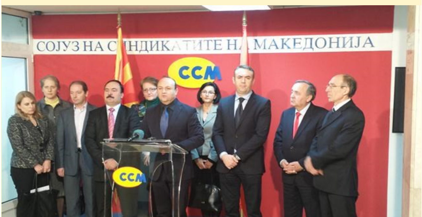
По повод настанот CSM и OPM одржаа конференција за печат

Единствено синдикално организираните работници имаат можност активно да учествуваат во институциите на системот по пат на социјален дијалог и на тој начин да влијаат на креирањето на политиките во сите сфери на државата , а со тоа и да придонесат за подобрување на својата, односно работничката положба во општеството .