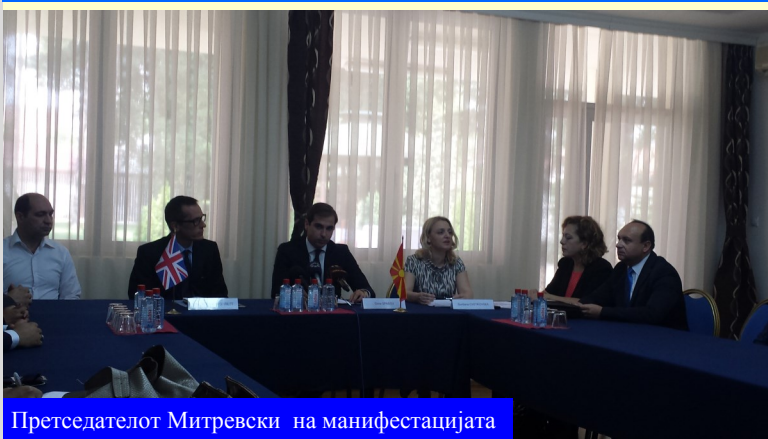
Претседателот Митревски на манифестацијата