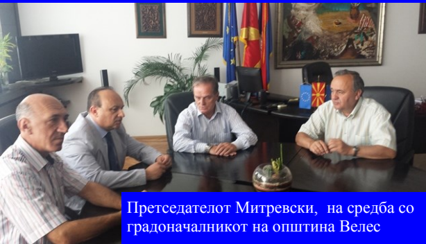
Претседателот Митревски, на средба со градоначалникот на општина Велес